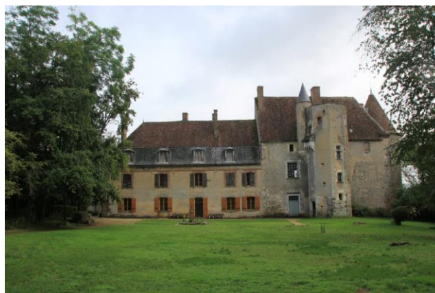
Château d'Arthé

Le matin, est prévue à 11h une visite guidée de l'église de Parly, connue pour ses peintures murales sera suivie d'un repas à l'auberge du Cheval Blanc à Parly, à 12h15.