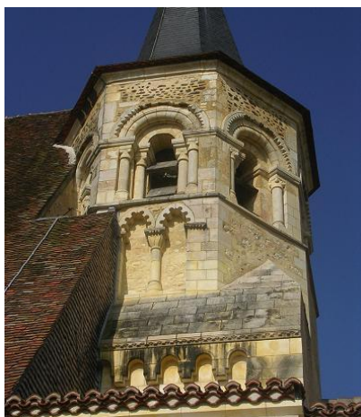
Clocher roman de l'église de Parly