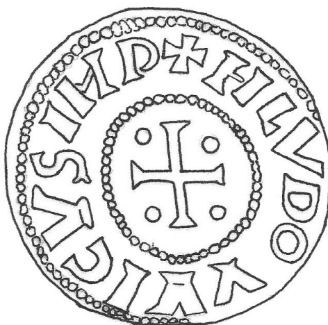
Droit d'un denier de Louis le Pieux (814-840) provenant de Cézy : diam. 20 mm, poids 1,23 g.

l'habitat (localisation, emprise, composants, organisation, ...), quel était son rôle, à quelle date il a été utilisé puis abandonné.