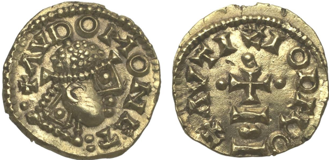
Tiers de sou de l'atelier d'Auxerre

Conférence de Monsieur Éric VANDENBOSSCHE Ancien président de la Société d'Études Numismatiques et Archéologiques (SENA)