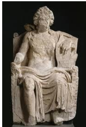
Entrains-sur Nohain Statue d'Apollon Cytharède Déposée au MAN de St Germain en Laye

La nature de l'occupation et l'étendue de l'agglomération d'Intaranum sont appréhendées grâce aux nombreuses découvertes anciennes depuis le XVIIIe siècle ainsi que par la succession des chantiers - fouilles archéologiques depuis 1966, dont les produits sont exposés dans le beau musée que nous visiterons.