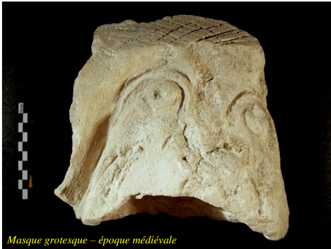
Masque grotesque – époque médiévale

Nous vous proposons de découvrir les collections de matériel archéologique présentées par la municipalité de Villemomble (Seine-Saint-Denis) dans l'ancien château de la localité (visite programmée en décembre 2018 mais annulée en raison des événements...). La visite se déroulera l'après-midi, à 15 heures . Les objets présentés (des sarcophages mérovingiens en plâtre portant de curieux décors, des tessons de céramique antique, des poteries médiévales et post-médiévales, des éléments architectoniques, des vestiges funéraires, des objets de la vie quotidienne et des accessoires de vêtements datés du VII e